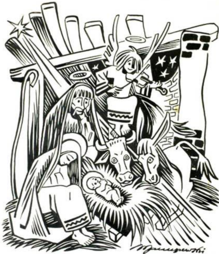
rys. Witold Januszewski