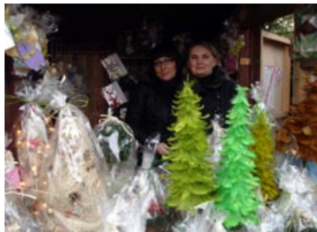
Stoisko naszego Domu na kiermaszu świątecznym

w Klasztorze Klarysek przy kościele św. Andrzeja. Szopki krakowskie to związane ze Świętami Bożego Narodzenia dzieła sztuki rękodzielniczej. Pierwsze szopki krakowskie powstały w połowie XIX wieku. W okresie świąt chodzili ze swymi szopkami po domach ich twórcy: cieśle, mura-