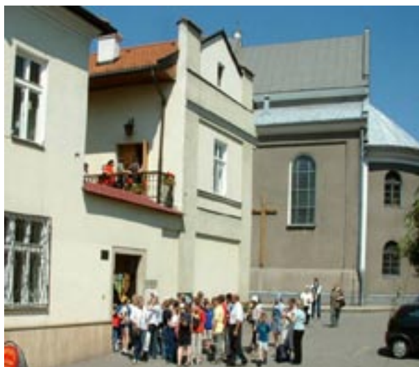
Dom rodzinny Jana Pawła II w Wadowicach

21.09 Uczestniczyliśmy w Mszy Świętej w Sanktuarium Pana Jezusa Ukrzyżowanego w Krakowie-Mogile. Na Mszę taką co roku w oktawie uroczystości odpustowych Metropolita Krakowski ks. kard. Stanisław Dziwisz wraz z Caritas Archidiecezji Krakowskiej zaprasza osoby chore i niepełnosprawne. Podczas Mszy były czczone relikwie Krzyża Świętego. Po Mszy zostaliśmy zaproszeni na poczęstunek organizowany przez Ojców Cystersów.